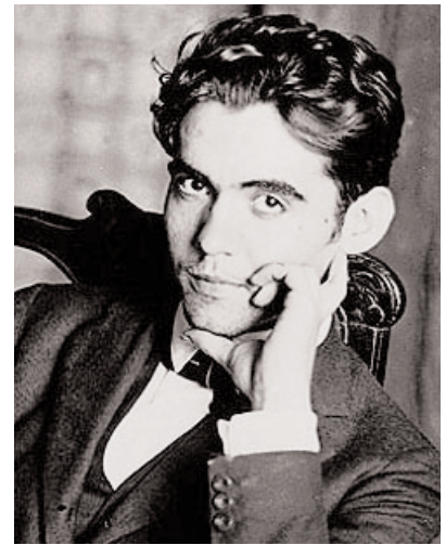
© R. Robles - F. García Lorca

Que lo que no me des y no te pida será para la muerte, que no deja ni sombra por la carne estremecida.