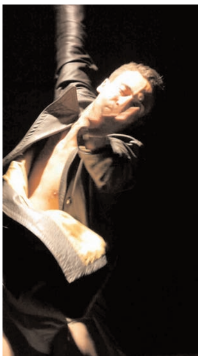
© Patrick André - Cie Gianni Joseph

Actualmente tiene su propia Compañía. www.franciscovelasco.com